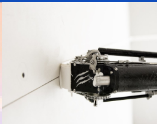
Aplicare banda de imbinare si pasta la plafon cu imbinare placi gips carton