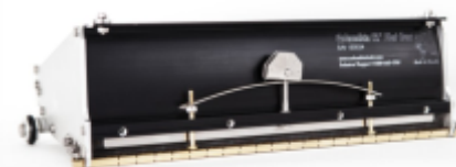
Faza 1 - C-Box20

Cutie pentru aplicare pasta pe imbinari drepte C-BOX20 pentru prima mana C-BOX25 sau C-BOX30 pentru a doua mana Se utilizeaza cu MBOX