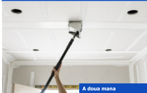
A doua mana