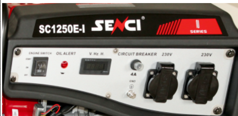
Panou de control