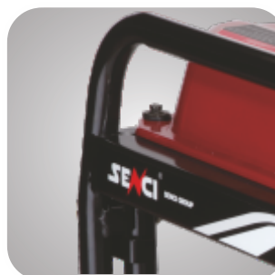
Cadru tratat pentru a preveni ruginirea