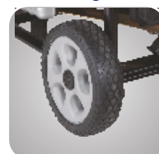
Kit roti si manere