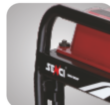
Cadru tratat pentru a preveni ruginirea