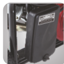
Filtru de aer patentat