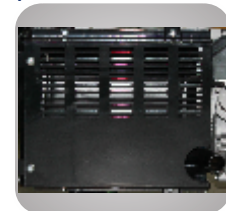
Esapament unic ce reduce zgomotul