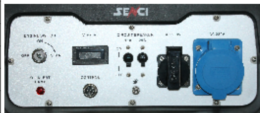
Panou de control