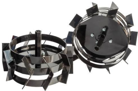
Set roți metalice 400 mm sau 500 mm cu adaptoare de fixare