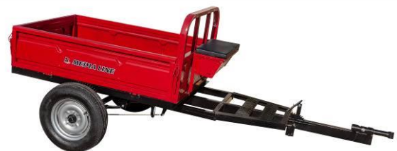
Remorcă 400 kg sau 500 kg