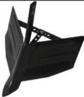
Accesoriu deschis rigole reglabil