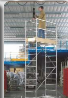
Millenium 4.08m (Modul A+B)