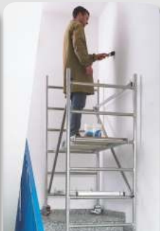
Modul A utilizat pe scari