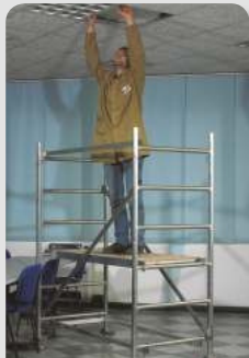
Millenium 1.95m (Modul A)