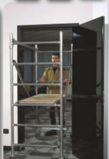
Incape cu usurinta pe usi