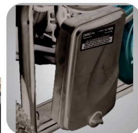
Filtru de aer patentat