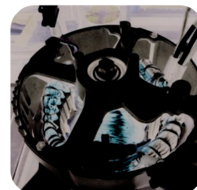
Alternator produs si patentat de Senci